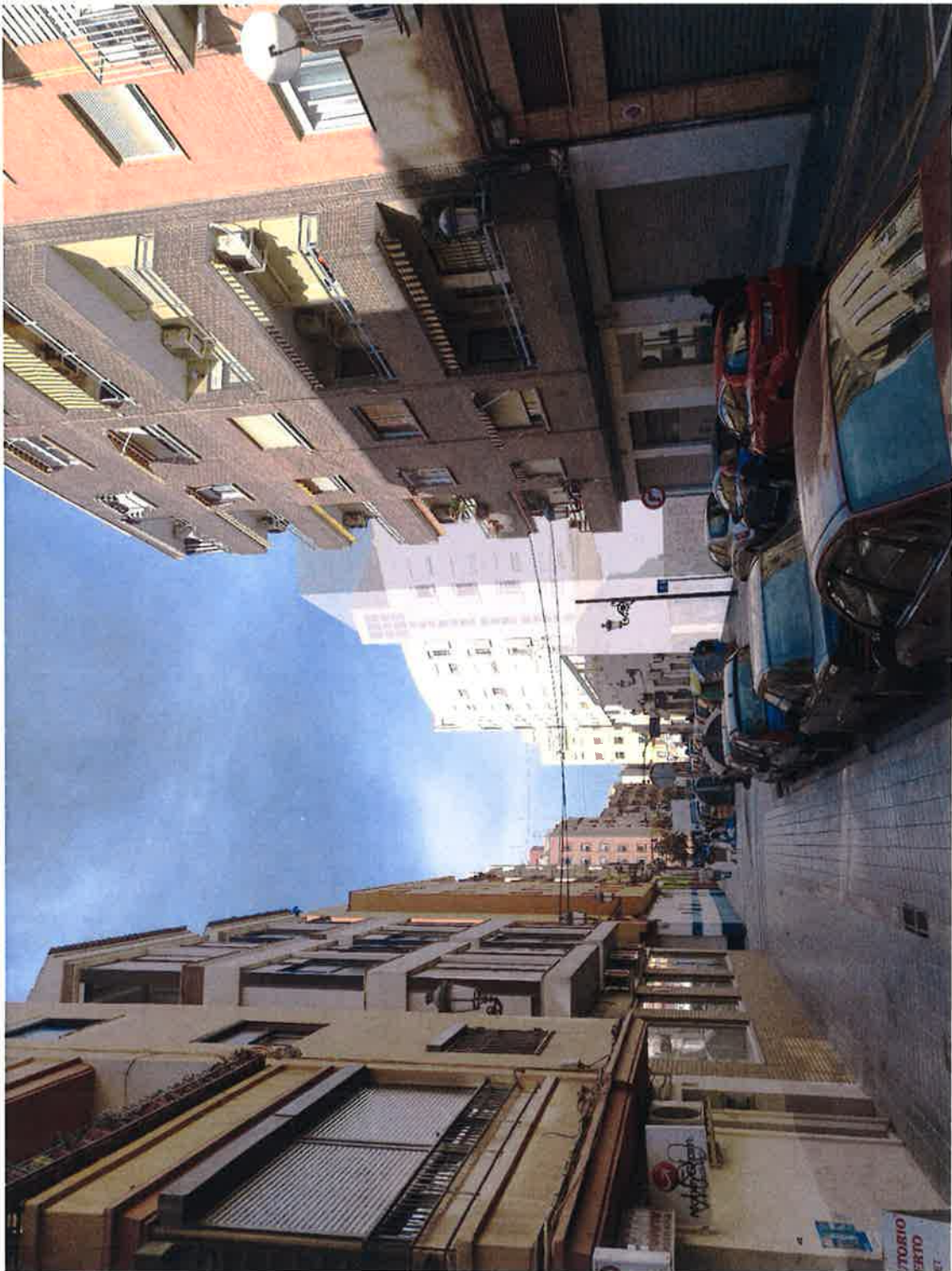
Nueva Ordenación. La edificación se retira en las plantas altas