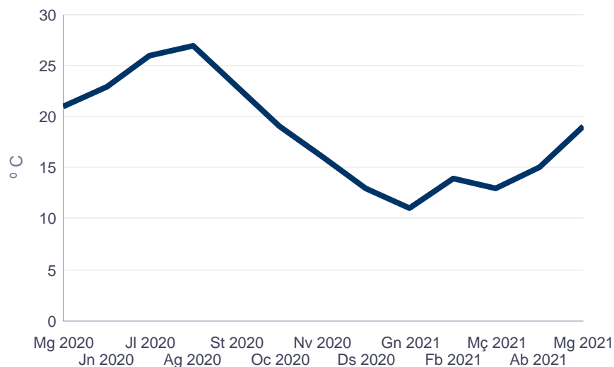
Temperatura media mensual. Estación Viveros Temperatura mitjana mensual. Estació Vivers

Nota: La temperatura s'expressa en graus centígrads. Font: Agència Estatal de Meteorologia.